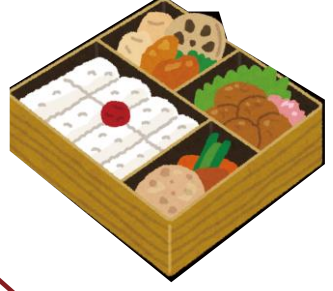
昼食のイラストはイメージです