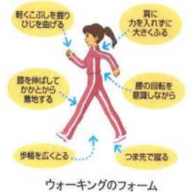
ウォーキングのフォーム